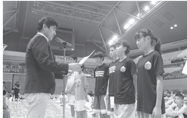
マナー賞の表彰(バスケット)

企業トップなどとの人脈を構築していました。また、ベースボール・マガジン社に勤めていた時には、柔道大会などイベントを企画運営していたこともあり、協賛もすぐに集められると考えていました。